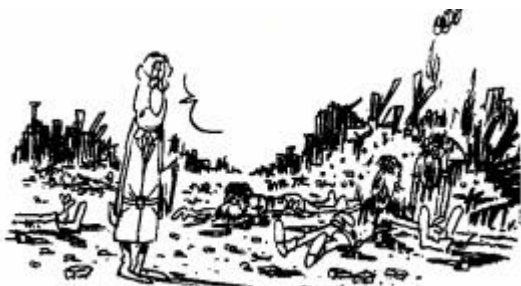
Hara-kiri sur l'environnement technique

La généralisation de la sous-traitance dans le technique n'est pas une fatalité. Luttons pour conserver nos emplois dans un domaine qui est le véritable cœur de métier de l'entreprise, il en est encore temps !